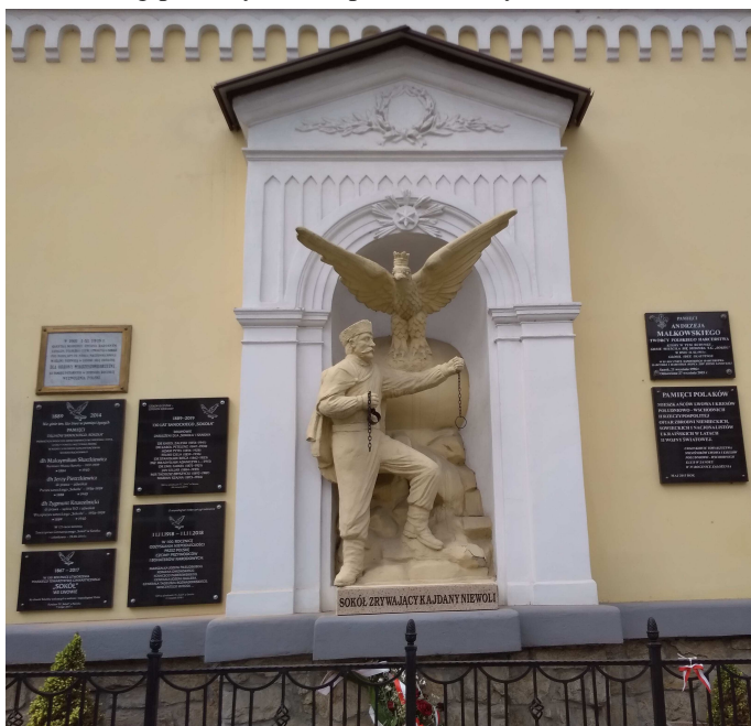
Sokół zrywający kajdany niewoli orłowi i 7 tablic pamiątkowych