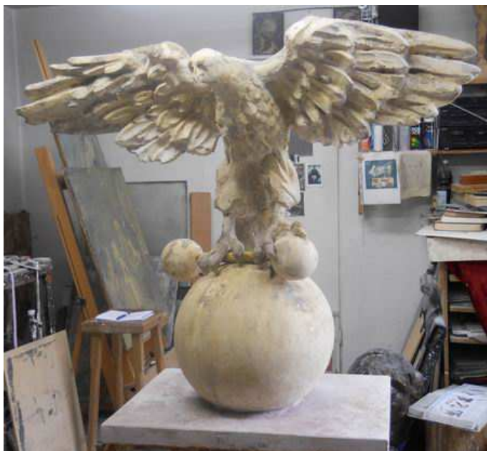
Rzeźba sokoła w gipsie, wykonana przez dr. Krzysztofa Woźniaka w 2012 r.